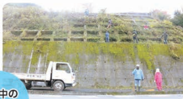
作業中の様子(抜粋)