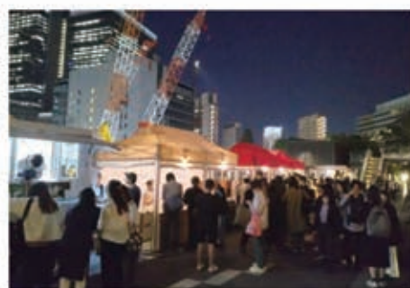
TOKYO TORCH での ゼロ・ウェイスト PR イベントの様子