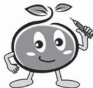
マスコットキャラクター 「つっちー」

明るい農林業・農山村を次世代へつないでいくためには、農林業センサスへの皆さま一人ひとりのご協力が必要です。