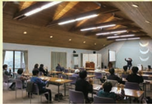
地域主体の通いの場（フレイル予防教室）