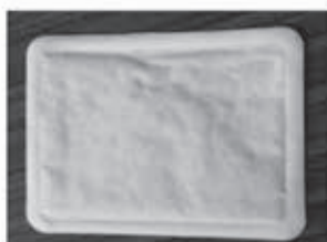
カイロ か 埋立て