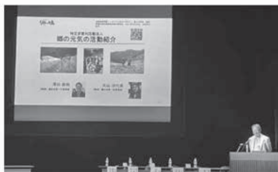
シンポジウムでの事例発表

今後も、人や組織への支援を続けると共に、継続的な都市農村交流・協働をおこなうことで、上勝町の環境・経済・コミュニティ・文化等の元気な姿を後世に伝承していきたいと思っております。