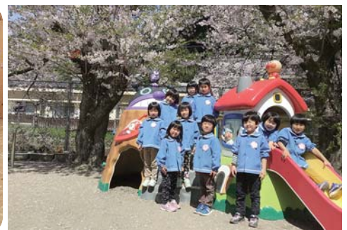
クラスごとに集合写真を撮影 (写真は5歳児のみなさん)