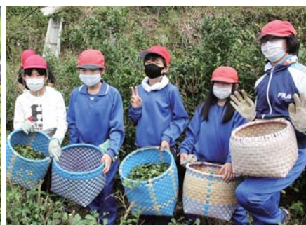
カゴいっぱい摘めました!