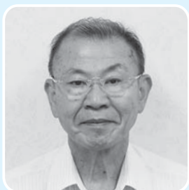
笠 松 和 市 〔町内全域〕