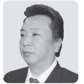
岡本 明 議員