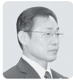
田中 寛 議員