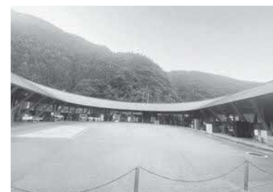
ゼロ・ウェイストセンター