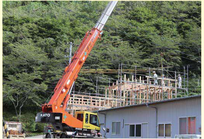
環境公社車庫建前