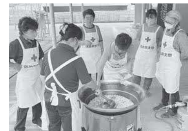
防災訓練 炊き出し

答 清井住民課長 藤川地域からは、赤十字奉仕団の設立意向を聞いていない。設立の意向があれば、事務局の社会福祉協議会が対応する。