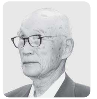
明本 恵一 議員

要望 在職中は、幾多の苦難や困難で心を痛めたこともあったと思うが、今後とも健康に留意されますますのご活躍をお祈りします。