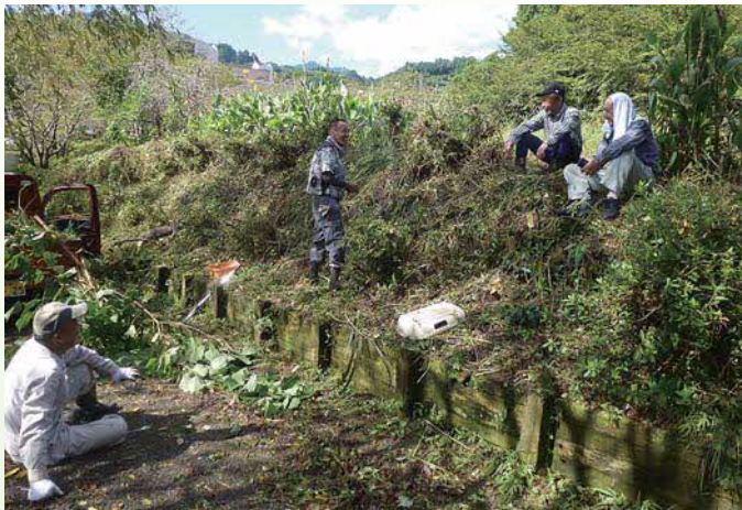
南岡 彩公園草刈り