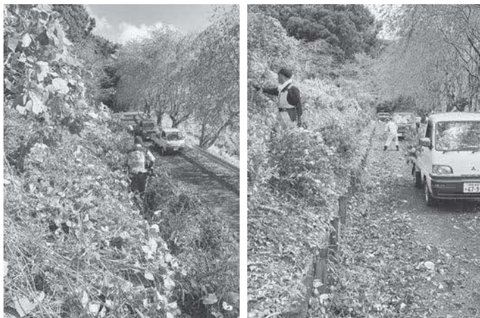
南岡 彩公園草刈り

要望 株いどりの方が10人に説明をして謝礼で対応は理屈が通らないと思う。検討してほしい。その他、入札、落札等に関する質問、ふるさと納税についての質問を行った。