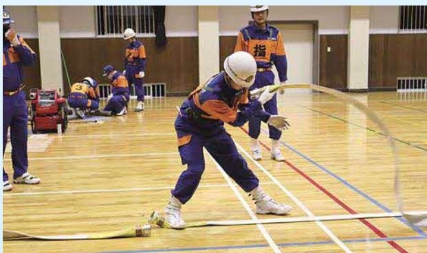
藤川 消防操法練習風景