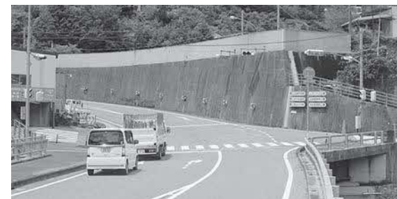
点滅信号化が望まれる交差点

【答】 中原参事兼建設課長 設置の経緯は橋が架設された時に交差点で事故が発生し、交通量から考えて本来設置が難しい所を地元要望で整備されたと聞いている。以降は大きな事故もなく、高齢化が進む町内住民が安心して通過できる交差点となっており、質問の通り、常時通行量は多く無い。押しボタン信号機への変更は、子供たちの交通安全に寄与すること。又、交通量の少ない時間帯は止まらずスムーズに通行でき、総てが〇。しかし押しボタン式に慣れると赤信号になってもそれを