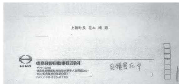
令和3年度の入札額を入れた封筒