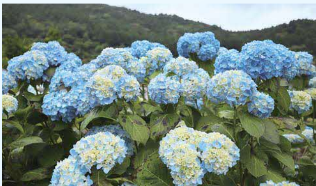
生実 あじさいの花