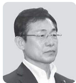
田中 寛 議員