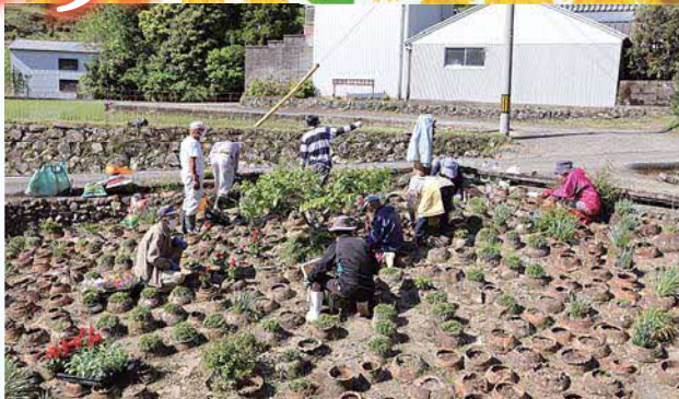
生実 トボス花の植え替え