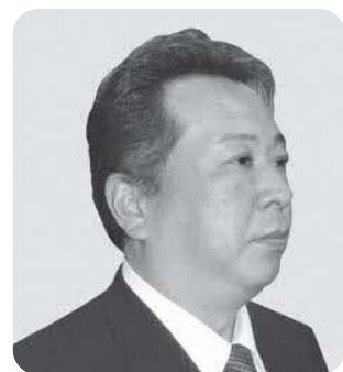
岡本 明 議員