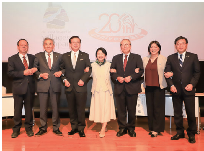
20周年記念式典 登壇者集合写真(令和7年10月24日)

今後引き続きより良いまちづくりに努めてまいりますので、ご協力どうぞよろしくお願いいたします。 発足から20周年という節目を迎えました。本連合は7町村から発足し、本町は立ち上げメンバーの1つです。発足から町民の皆さまとともに20年以上にわたり、美しいまちづくりに取り組んできた結果、今もなお美しい棚田の景観や伝統・文化を受け継ぐことができました。