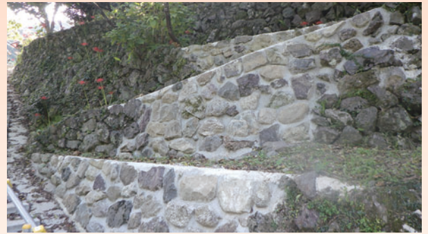
集落再生事業 集会所進入道の整備

集落再生事業については地域の皆様のご尽力により集落の自立的事業として実施いただいております。今後とも積極的にご活用ください。また、空き家の情報提供等も引き続き、ご協力をお願いいたします。移住定住政策として、町に「13泊14日」滞在し、観光より一歩踏み込んだ「暮らし」を体感し、町民との交流を通して理解