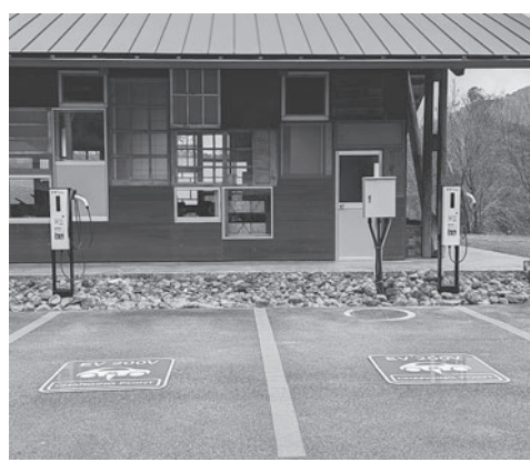
ゼロ・ウェイストセンターの設置状況