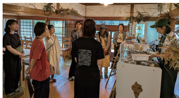
周年イベントで移住ツアー参加者と移住者との交流

しており、「ゼロ・ウェイスト宣言」実現に向け、住民負担の軽減・経済循環・教育を柱として取り組みを進めて参ります。昨年7月からごみの運搬支援を受けられる範囲を、車をお持ちの「80歳以上のみ世帯」も利用できるよう拡大しています。また、リサイクル推進に向けて企業と包括連携協定を締結し、ゴミステーションにおいて町内の家庭から出る紙おむつ類を燃料に加工