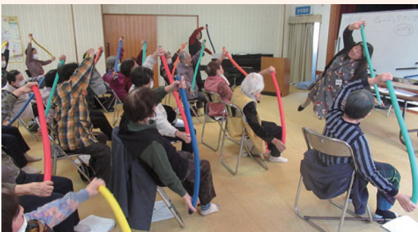
音楽介護予防教室

子ども・子育て支援につきましましては、子育て世帯の経済的負担軽減のため、令和7年9月より、所得制限を設けない「保育料の完全無償化」を実施しております。また、母子の産後の心身の安定や育児不安の軽減を目