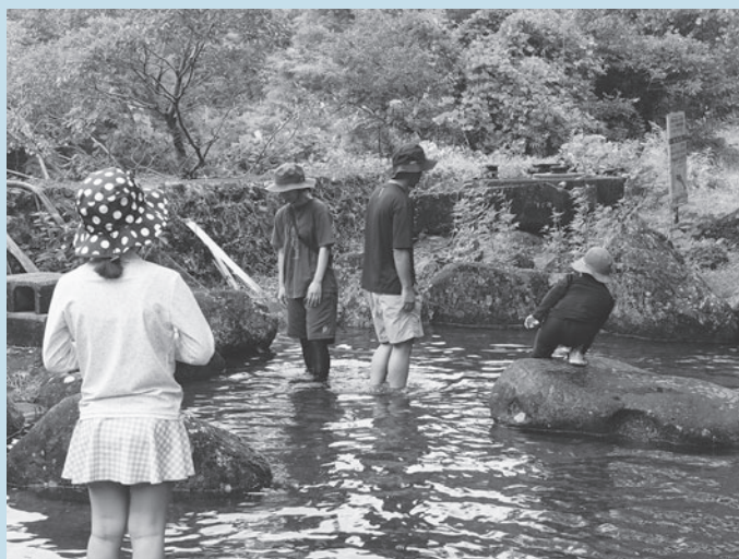
アメゴの掴み取りイベント

イベントなど、主にファミリー向けのイベントを企画・開催しました。アメゴの掴み取りは予約も1時間足らずで埋まってしまいうほど、特に町外のお客様にご好評いただきました。