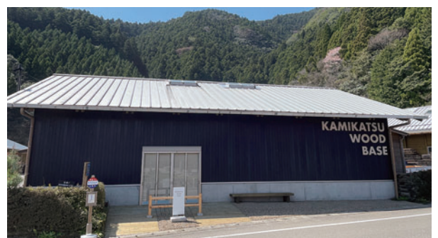
WOOD BASE（森林環境譲与税を活用）

農業振興については、農地の保全と集落環境整備の観点から、引き続き農業委員会による「農地利用状況調査」を実施しつつ、農用地の利用集積に向けて取り組んで参りますのでご協力をお願いいたします。また、彩や香酸柑橘をはじめとする農産物を安定的に出荷できるように、鮮度を長期間・高品質に保つことができる鮮度保持技術「ZEROCO」の導入に向け、実証実験等を重ねて参ります。今後も県など関係機関と連携し、