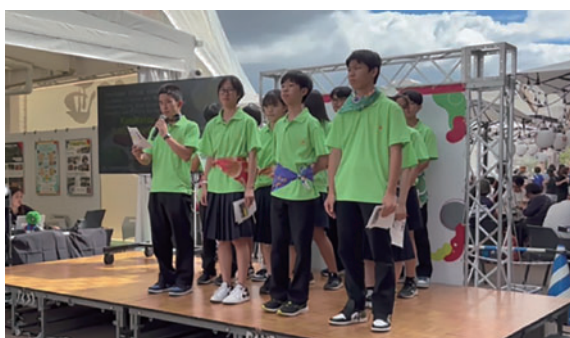
大阪・関西万博での国際交流活動発表

令和8年が皆様にとりまして、ご健勝で幸多き年でありますよう、心からお祈りいたしまして年頭のご挨拶とさせていただきます。