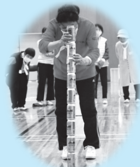
お見事 空き缶9本積み！