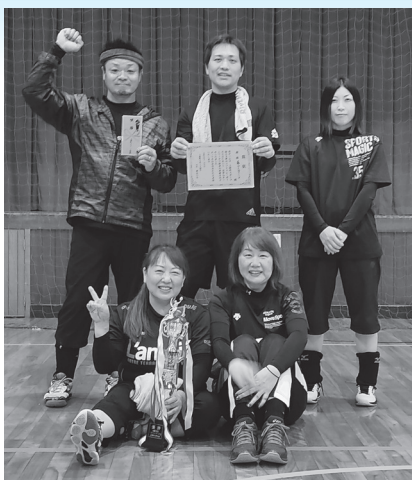
優勝 上勝ガンパロウズ

この大会のために練習してきたチームも多く、熱戦が繰り広げられました。結果は、チーム名「上勝ガンパロウズ」が優勝しました。