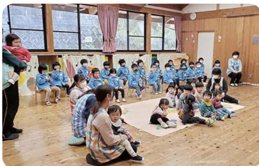
今年は新型コロナウイルス感染症対策のため、入園式は行いませんでした。