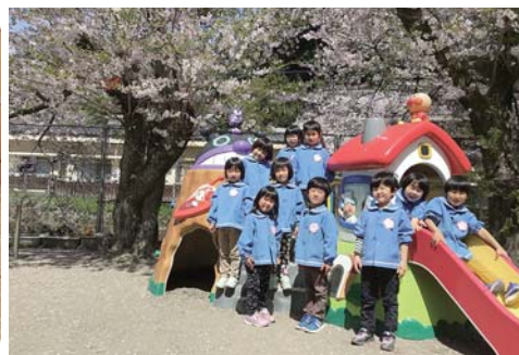
クラスごとに集合写真を撮影 (写真は5歳児のみなさん)