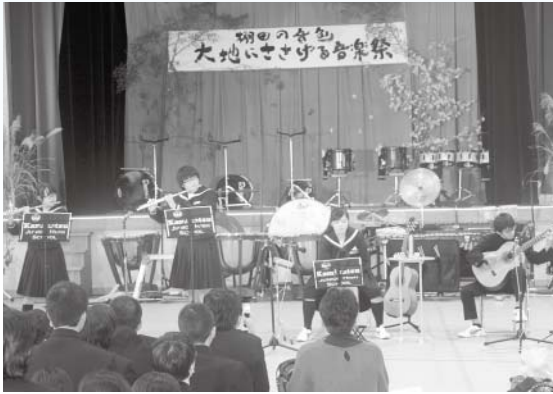
上勝中学校音楽部の演奏