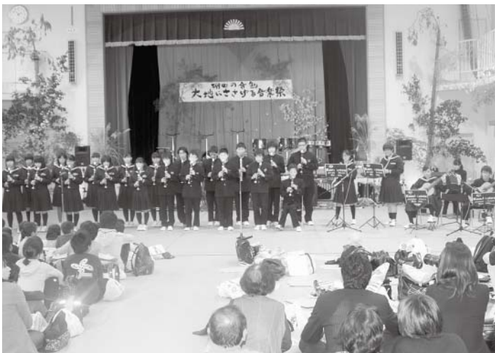
上勝中学校全校生徒の演奏