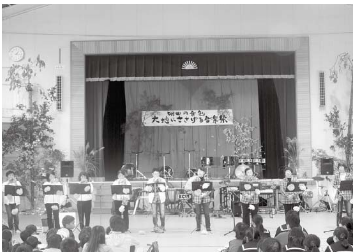
エスぺランサの演奏