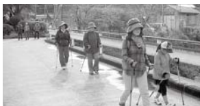
わきあいあいなウォーキングとなりました!

また、旭川周辺では、秋の紅葉を觀賞し、湯っ足り神田茶屋では、足湯体験も行われました。