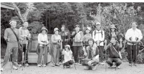
湯っ足り神田茶屋にて記念撮影♪