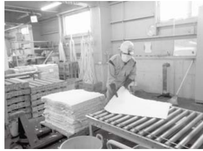
紙おしめから再生された紙