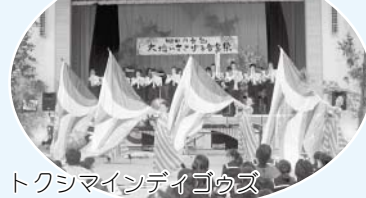
トクシマインディゴウズ

11月8日(日)に第14回棚田の音色~大地にささげる音楽祭~が旭体育館で開催されました。