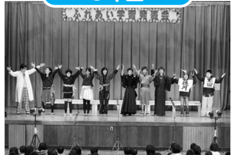
バックトゥザフューチャー