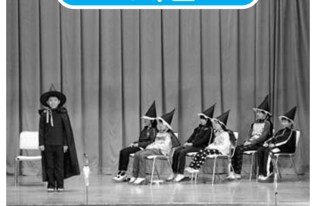
カミー・カッツーとまほうの葉っぱ