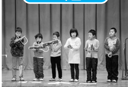
「2年1組はつ明じおしよ」ほか