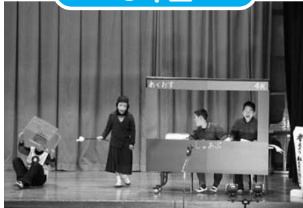
考えよう！私たちの防災