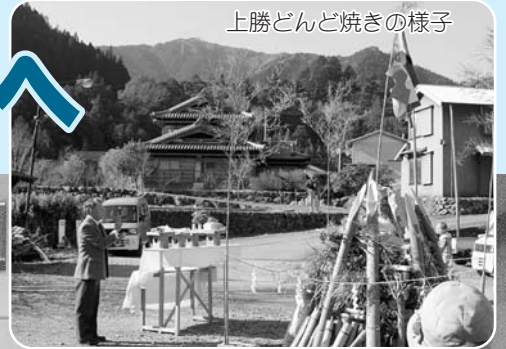
上勝どんど焼きの様子