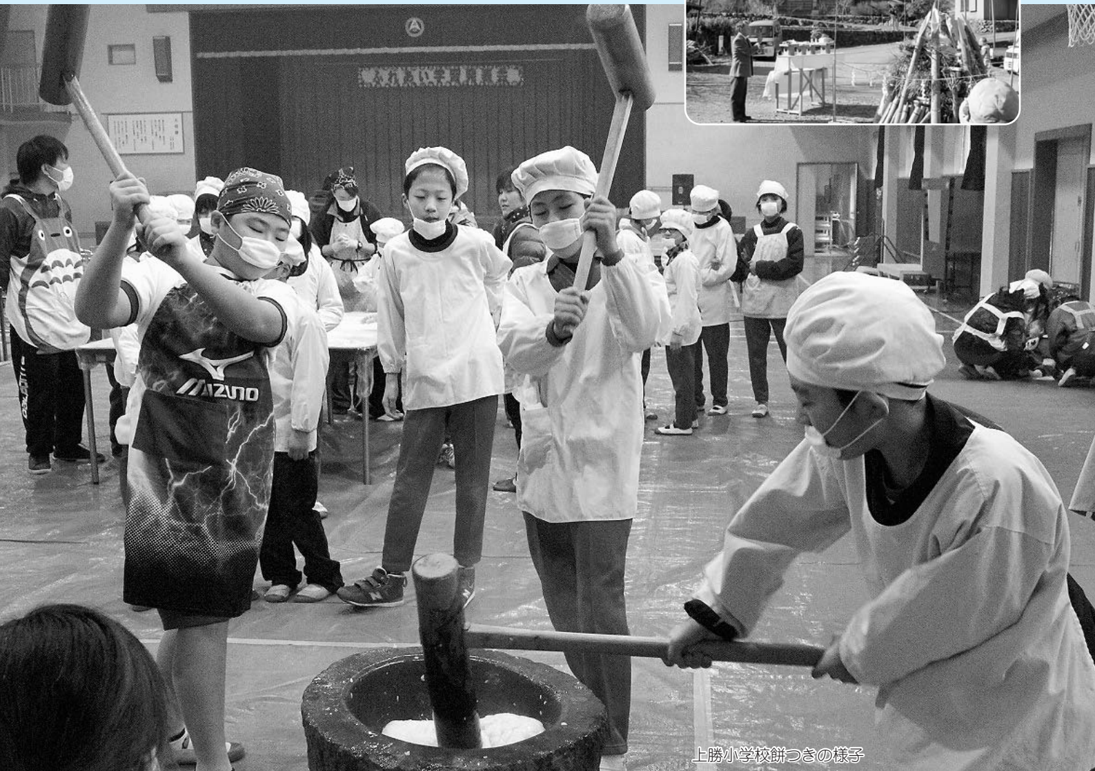
上勝小学校餅つきの様子