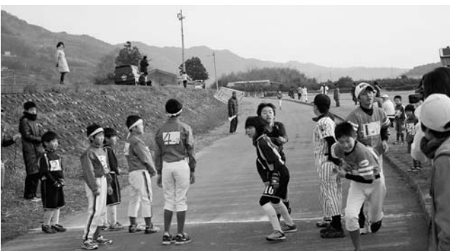
第29回勝浦郡スポーツ少年団連合会駅伝(男子の部)

先月号の上勝町広報紙掲載記事に関するお詫びと訂正 風邪癒えて背戸の畑で草を抜く 山里静かに秋を逝かしむ あや子