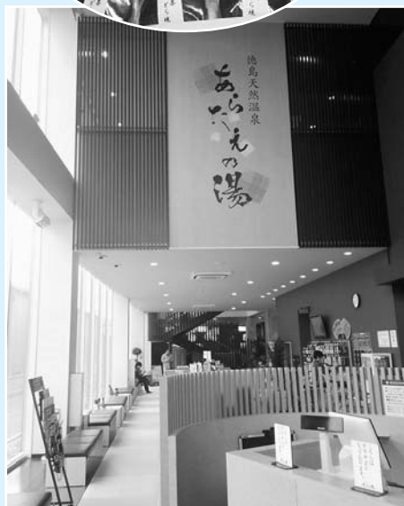
あらたえの湯(徳島市)での販売イベント