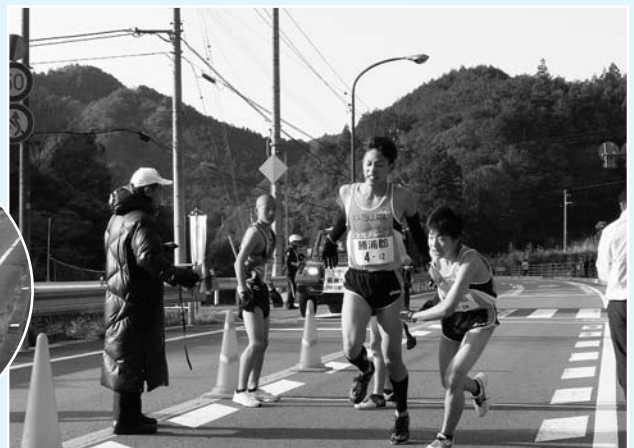
おもしろい！一緒ひとつでも上位 先輩から後輩へタスキをつなぐ

ていくことを解団式で誓い ていきました。 最後になりましたが、町民皆さまの暖かいご支援・ご協力に深く感謝申し上げます。