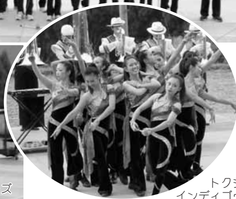
トクシマインディゴウズ