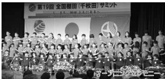
オープニングセレモニー