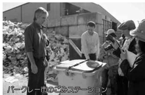
パークレー市のごみステーション