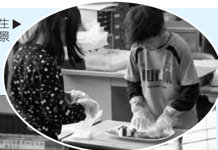
上勝小学校3年生 いりどり授業風景

午後からは、上勝小学校や上勝中学校の研究発表、文部科学省の教科調査官による講演会などを行い、県下から参加された百名以上の先生方が「上勝のよさ」を体感しながら、盛会のうちに終了することができました。