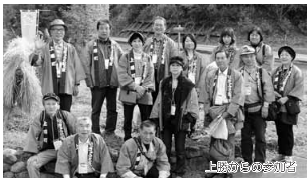
上勝からの参加者

今回のサミットでの意見交換や提言、また活動事例を参考に上勝町での農地保全管理や活用などに活かしていけるか検討していきたいと思えます。引き続き皆さまのご指導、ご協力をよろしくお願い致します