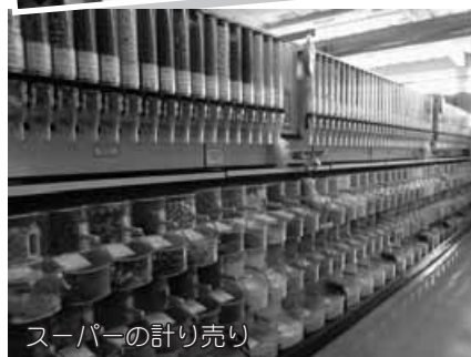
スーパーの計り売り

クの使用や計り売りが人々の日常に定着し、自然とごみの発生が抑制されているのが印象的でした。 しかし、資源化については上勝町民の徹底されたごみ分別は世界でもトップレベルで、世界から上勝の取り組みが注目されていることも再確認できました。 NPO法人ゼロ・ウェイストアカデミーでは、毎月第一月曜日に勉強会を開催しています。処理施設の見学なども行っていますので、一度お気軽に聞きにきてくださいね！