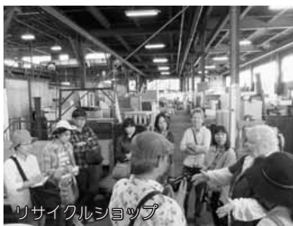
リサイクルショップ