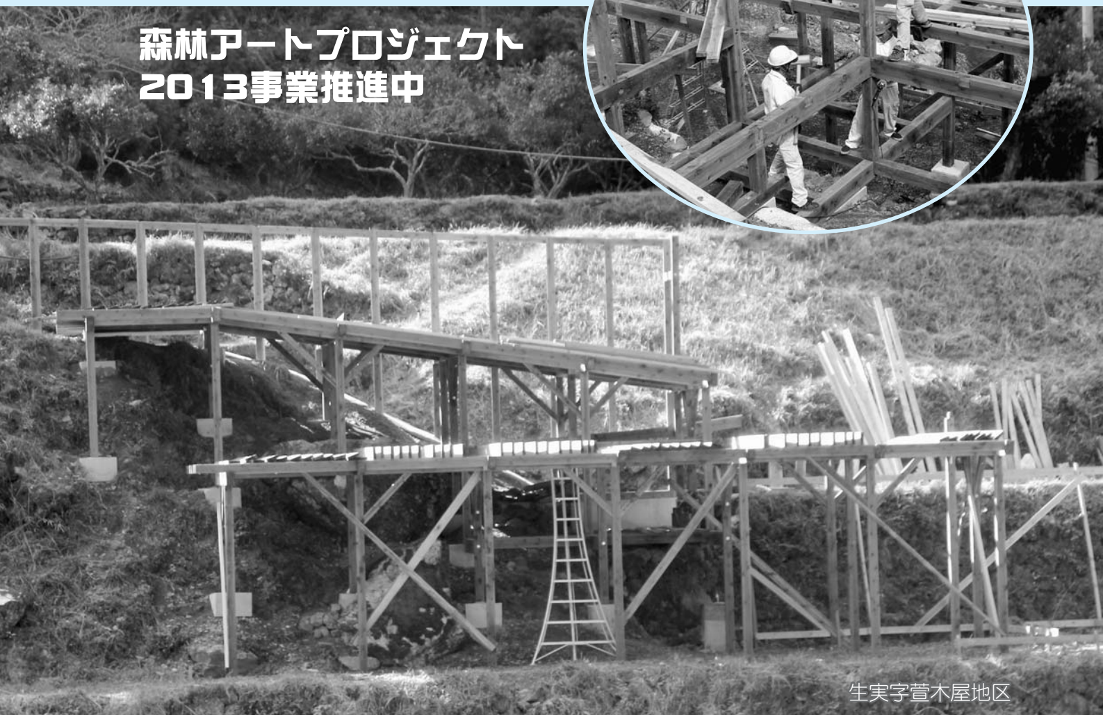
生実字萱木屋地区

棚田の音色～大地に捧げる音楽祭～ ほか …… 2 第19回全国棚田(千枚田)サミット ほか …… 3 ソフトバレーボール大会 ほか …… 4 平成25年秋季全国火災予防運動 ほか …… 5 ゼロ・ウェイスト宣言 …… 6 再生可能エネルギー設置補助金受付を延長 …… 7