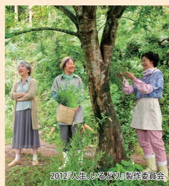
2012年映画「人生、いろいろ」撮影風景

本作は、そんな上勝町の実話から生まれた物語。長い人生の中で一度も主役にならなかった3人の女性たちが、料理の脇役であるつまものとの出会いを通していきいきと輝き出す姿は、「何歳になっても夢は追いかけるよ」「人生に遅すぎることはない」と観る者に優しく語りかける。