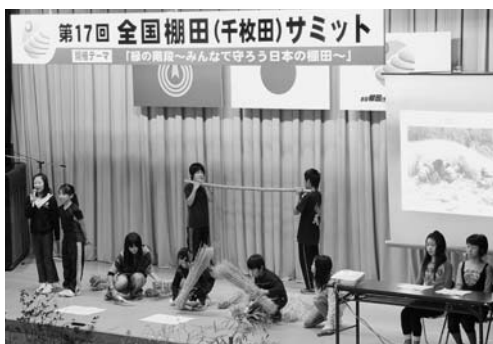
米作りの取り組みを報告する小学生