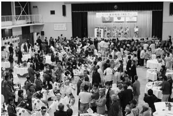
交流会で阿波おどりを披露

翌二十九日は棚田四ヶ所の現地案内、各地で特徴のあるそれぞれの棚田の景色や、心のもつたおもてなしを受け、地元の方との交流を堪能していただきました。