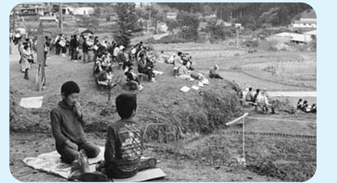
ここが、僕たちの特等席