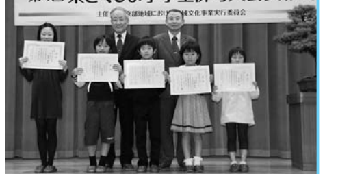
第4回 東とくしま小学生俳句大会表彰式