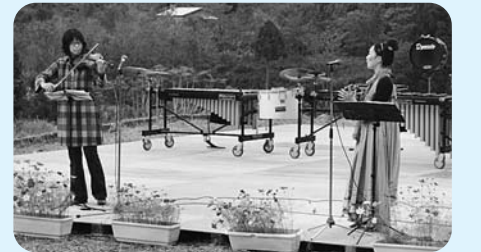
サウンド・オブ・協力隊

最後になりましたが、開催にあたりましてご尽力、ご協力、ご支援をいただいた皆さま、本当にありがとうございました。 棚田の音色実行委員会一同